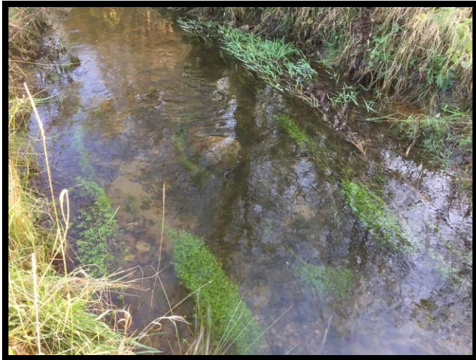
Vandpleje giver resultater