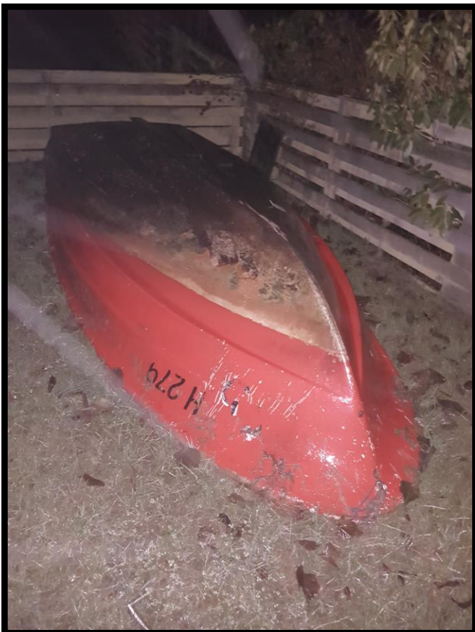
Båd 2 500,-kr.