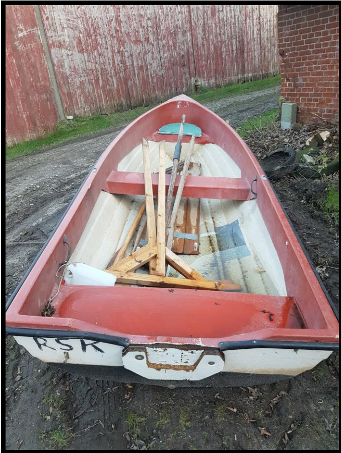
Båd 1 500,-kr.